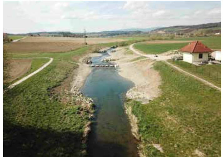
Renaturierungsmaßnahme bei ehemaligen Eisenbahnbrücke (wurde 2019 bereits umgesetzt)